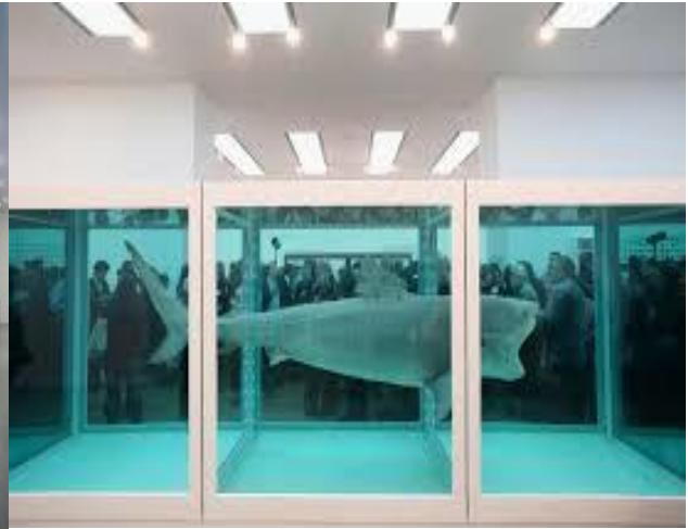
Der: "The Physical Impossibility of Death in the mind of Someones Living" por Demian Hirst

Entre las instalaciones que buscan provocar una reacción física en el espectador generando ambientes, encontramos la obra de Olafur Eliasson (Dinamarca 1967) quien trata sobre los fenómenos naturales, las leyes de la física y la percepción sensorial, como lo es su célebre instalación "Weather Project" presentada en el Tate Modern en 2003 donde recreó un clima artificial logrando una estrecha interacción con los espectadores.