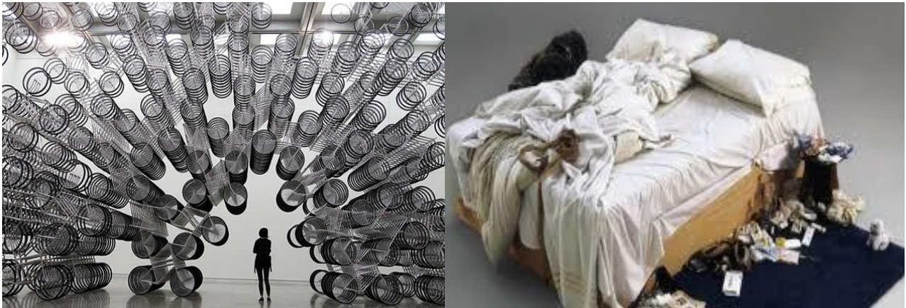
Izq. Obra de Ai Weiwei : “ Forever b “ der. “Cama deshecha” por Tracy Emin

Donde en todo ello da plena cabida la idea o significado que da el artista y lo que individualmente siente cada espectador frente a la obra. Aunque está claro que no sea su intención elemental, muchas instalaciones se caracterizan por incitar rápida y fácilmente asombro, espectacularidad o polémica.