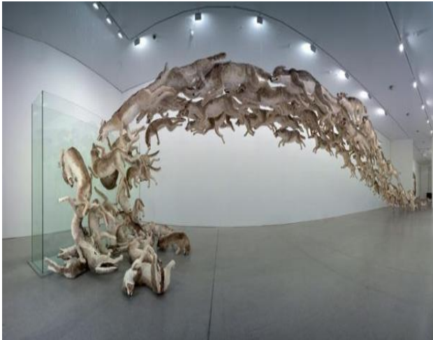
Izq. "Head On" por Cai Guo –Quiang