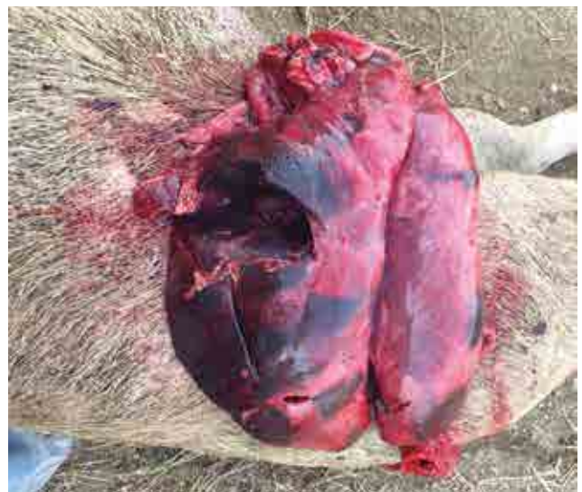
FIGURA 3 Pleuroneumonía fibronecrotica.