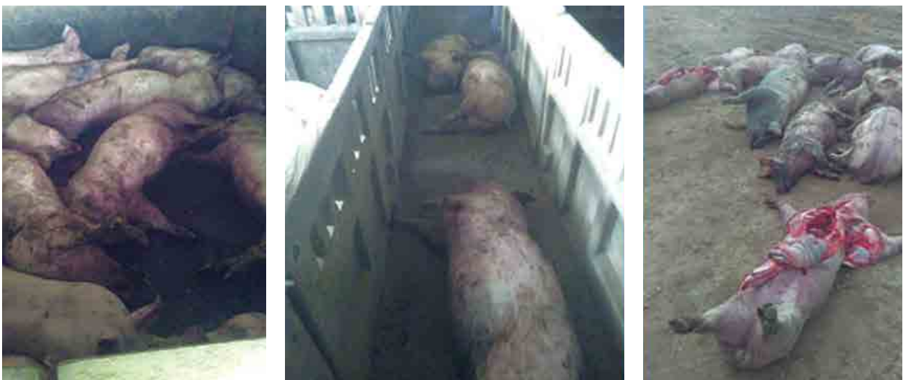
FIGURA 1 Aparición de bajas en la explotación.

Se produce un aviso de un engorde el lunes 18 de marzo de 2019, donde se han producido un número elevado de