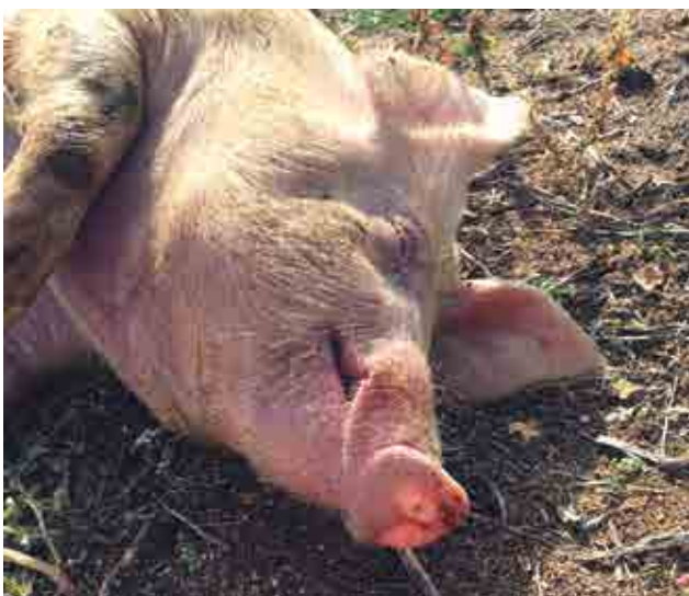
FIGURA 2 Descarga nasal espumosa.

Durante la visita se observa que todavía hay cuatro bajas más en un mismo corral. >